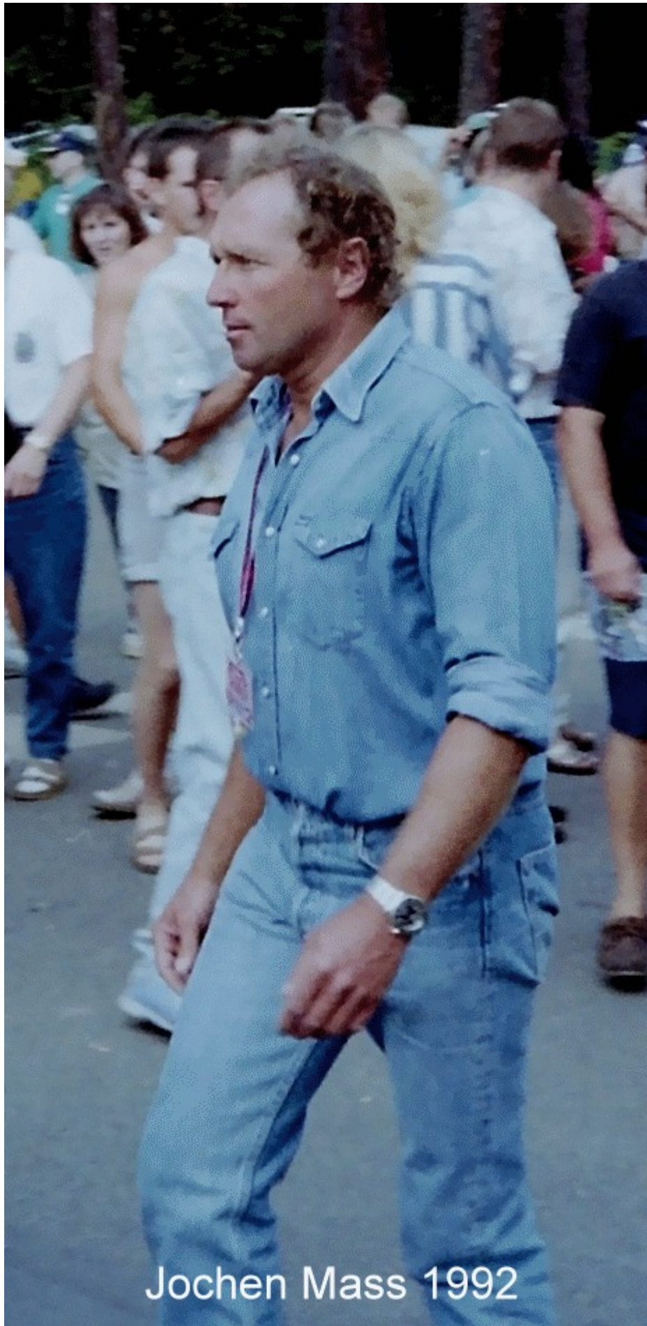
Jochen Mass 1992